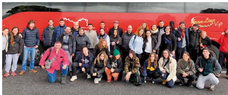
Joves catalans de diverses diòcesis

«Les inquietuds que tenim els joves d'aquí, també les tenen els d'arreu d'Europa encara que siguin d'altres confessions cristianes. A Alemanya, l'Església evangèlica hi té molta presència. De fet, la majoria de nosaltres vam ser acollits en parròquies evangèliques i això ens ha permès viure una trobada ecumènica molt més intensa. També vam col·laborar en diversos serveis, com són la participació en el cor i l'orquestra de Taizé, la vet-